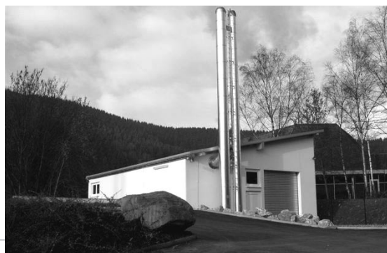
Inbetriebnahme des Biomasse-Heizwerkes, im Oktober 2004