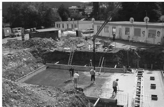
Arbeiten an der Bodenplatte des Tiefbunkers, im August 2004

weiteren Unternehmen, so z.B. der Kessellieferant, das Heizungsbauunternehmen und der Brennstofflieferant ebenfalls aus der naheliegenden Umgebung kommen und an diesem Projekt mitgearbeitet haben.