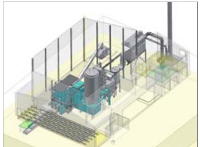
Darstellung des BMHKW