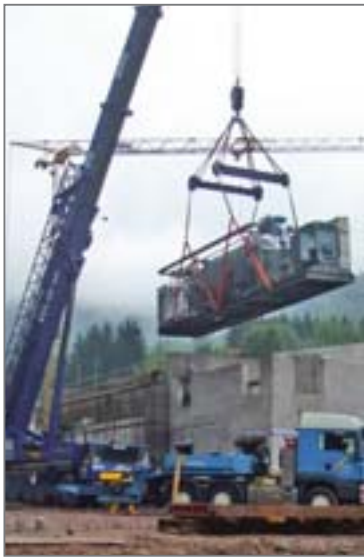
Die Anlieferung des ORC-Moduls

In einem Kondensationswärmetauscher wird der Silikondampf wieder verflüssigt und anschließend der erneuten Verdampfung zugeführt.