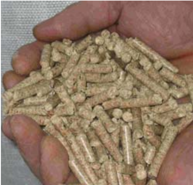
Zusammen mit den bekannten Holzpellets können in Zukunft auch bestimmte Getreidearten und Strohpellets verbrannt werden.